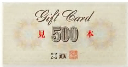
【新潟丸大ギフトカード】