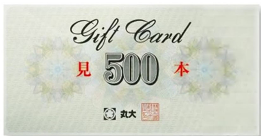
【丸大ギフトカード】