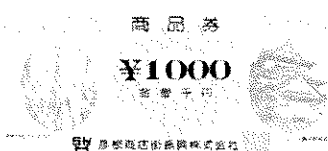
彦根商店街振興株式会社（1,000円）