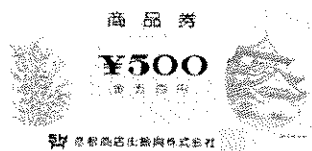
彦根商店街振興株式会社（500円）